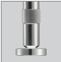
Montagebeispiel mit 22 mm Silikonadapter (835008)

Der Wash-Sensor H Dental Prüfkörper mit montiertem Adapter kann direkt in die Silikonadapter für Übertragungsinstrumente eingesteckt werden.