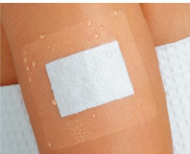
Curapor® transparenter Wundverband, steril