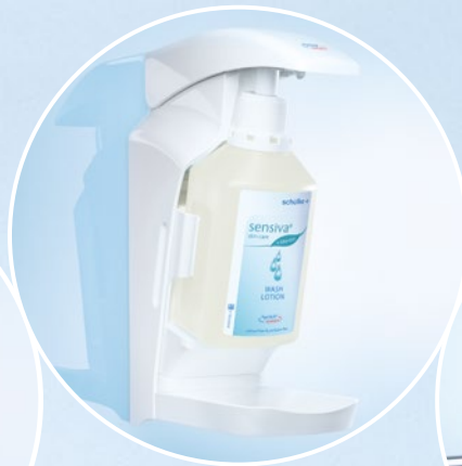
➤ Universal Flaschenhalter